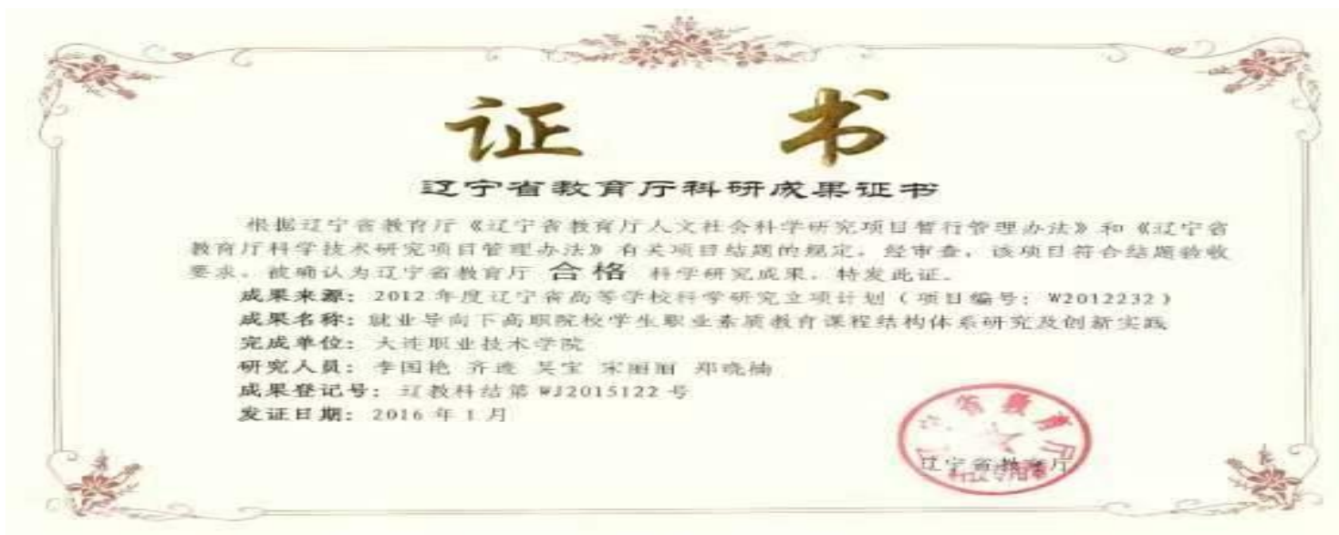
辽宁省教育厅科研成果证书