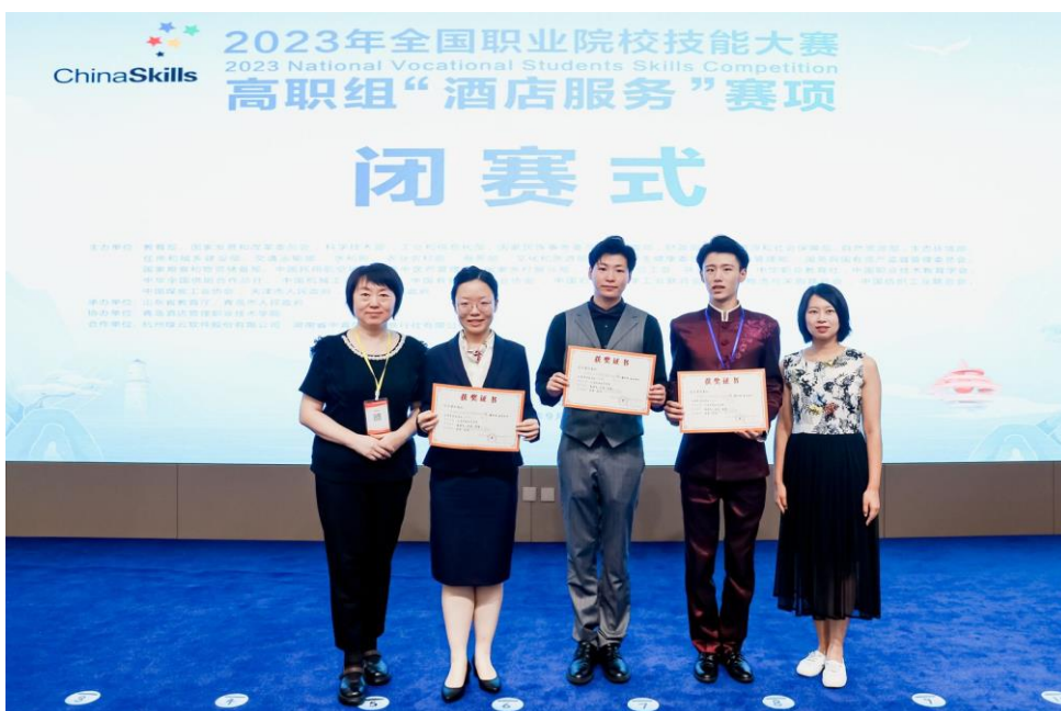
图 2-4：国赛酒店服务赛项团队合影