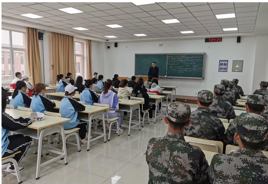
图 2-1 党员服务“亮承诺”——支部党员讲党课