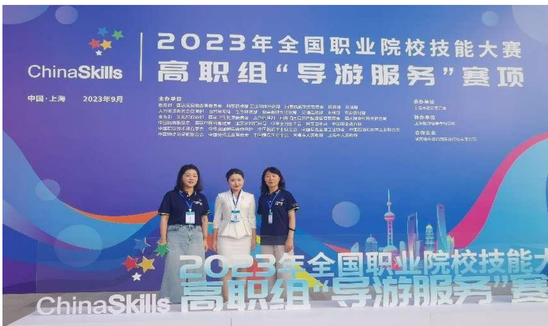
图 2-6：导游服务赛项团队合影