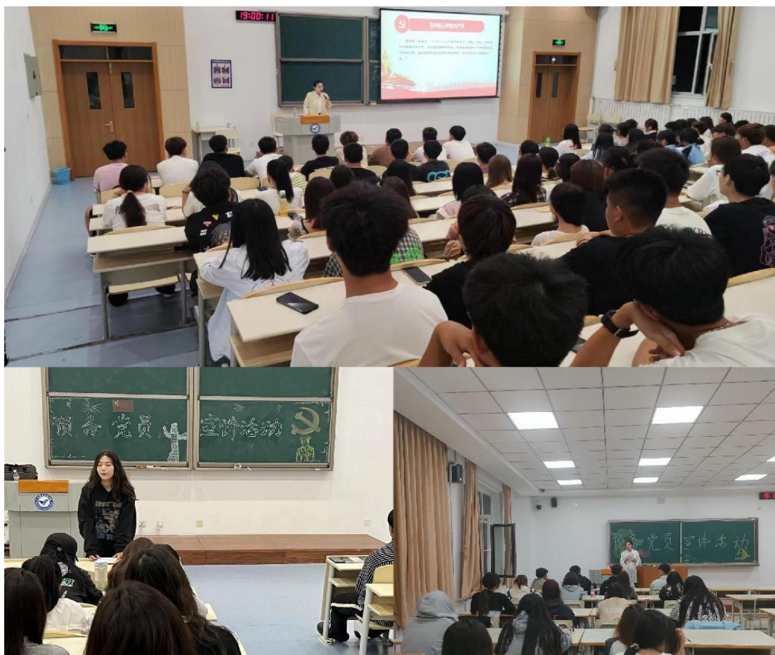
图 2-2 党员先锋“亮身份”——学生党员发挥朋辈引领作用