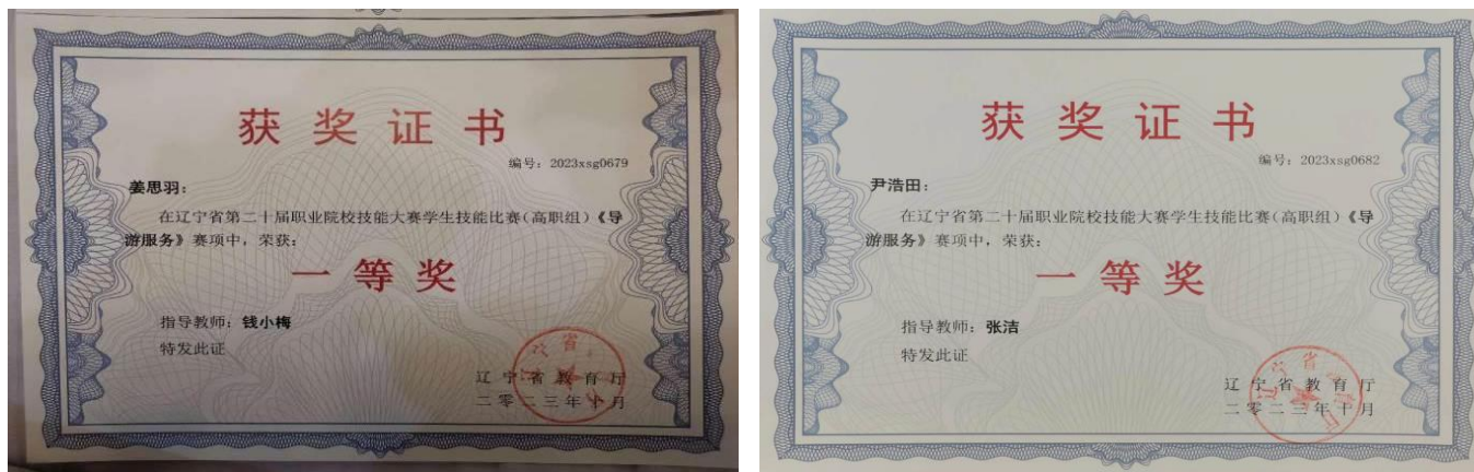
图 3-1 省赛一等奖获奖证书

继续推进旅游类专业“赛教融合”育人模式的构建与实施, 以大赛为引领, 推动教育教学改革, 优化人才培养模式, 将赛事训练有机融于日常课堂教学。通过五级大赛体系建设、人才培养方案制定、课程体系构建、学生职业能力养成等诸多环节, 实现大赛备赛与常规教学的有效衔接、课程标准与赛事标准的有机统一、大众教育与精英教育的和谐共存、在校教育和终身教育的有序递进。以制度形式规范育人模式, 将大赛职业技能要求融入到日常教学过程, 采取专业负责、全员参与、项目导向、层层推进的“赛教融合”育人模式, 全面促进学院专业教学提质创优。围绕赛教融合设计课程体系, 酒店管理与数字化运营专业制定兴辽未来工匠人才培养方案 1 项。顺利承办 3 项省级职业技能大赛。学生在各级职业技能大赛中屡创佳绩。学生获得职业院校技能大赛奖项总计 6 项, 其中, 获得了 2023 全国职业院校技能大赛三等奖 3 项, 2023 辽宁省职业院校技能大赛一等奖 4 项。