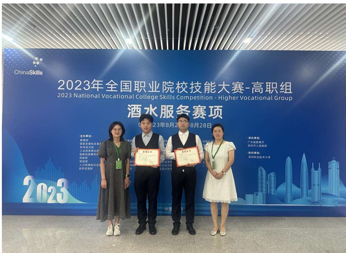
图 2-5：国赛酒水服务赛项团队合影