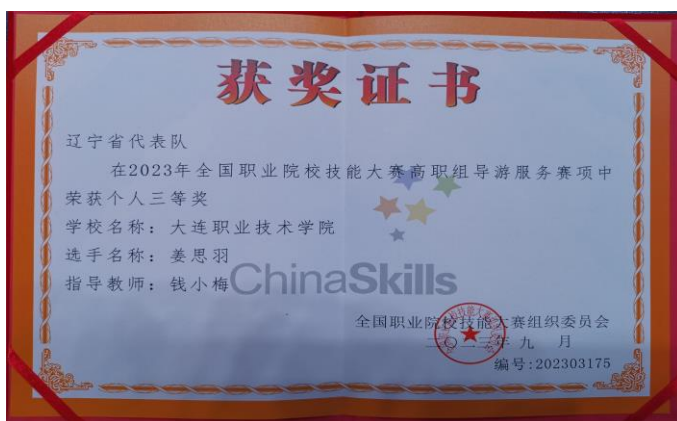
图 3-2 国赛三等奖获奖证书