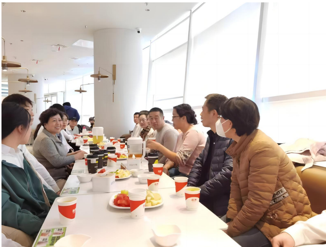
图 3-12：我院教师走访亚惠美食有限公司