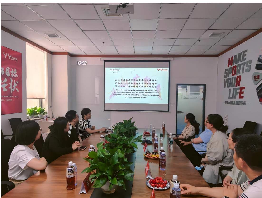
图 3-13：我院教师走访宝胜贸易有限公司胜道体育大连区部