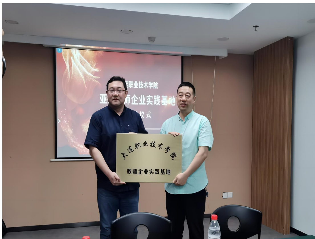
图 3-7：双方共同举行教师企业实践基地签约暨挂牌仪式

此外，学院还拥有 50 余名行业、企业专家组成的动态兼职教师库，其中本年度参与专业授课教学、辅导的企业兼职教师 23 人。承担学院近 50% 的实践教