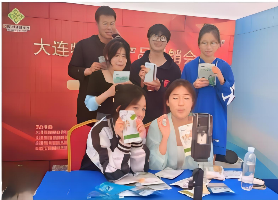
图 4-1：电子商务专业“卓越班”同学进行固定展位直播和流动直播

在大连市中山区天津街举办的 2023 年大连特色农产品展销会上，直播准时开始。负责网络直播的师生，通过流动直播和固定展位直播等多种方式，对展销会上的产品娓娓道来，与线上客户热情互动。直播小组轮流上阵，直播活动整整持续三天，主播们始终保持饱满的工作热情，也吸引了广大网友的关注抢购。