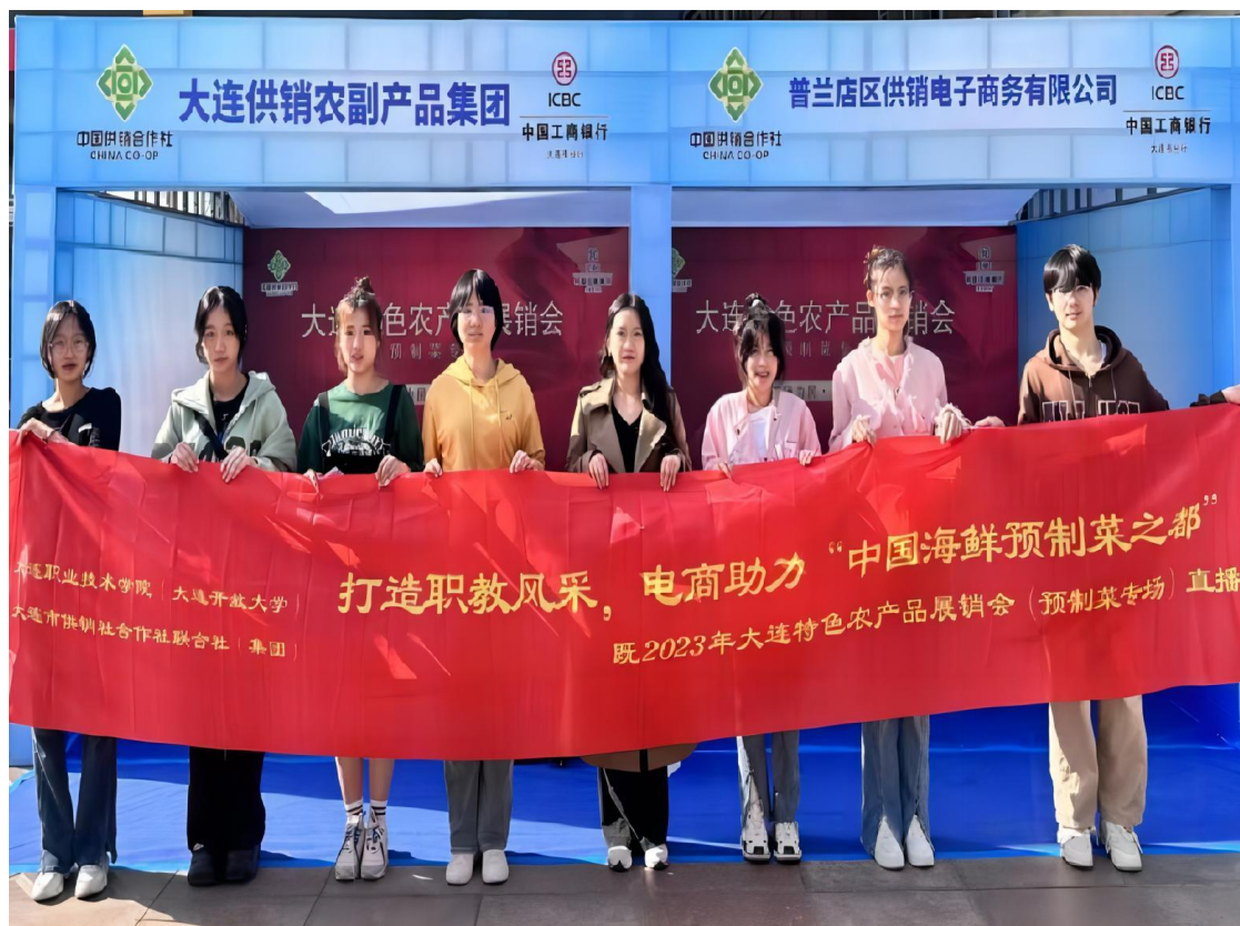
图 4-2：电商助农活动现场

此次“电商助农”系列直播活动，一方面丰富了职业教育教学方式，为学生的学习实践提供了新的平台和机会；另一方面，也展现了我校服务地方经济社会发展的能力，拓展了利用教育资源和学生实践为乡村振兴直接服务的新模式和新尝试。今后，学院将进一步深化产教融合，打造高职教育特色，创新育人模式，培养更多服务地方电商经济发展的高素质复合型专业人才。同时，将继续探索面向区域农民提供电商运营培训、数据运营分析等电商专业知识培训的新渠道，助力农产品推广、乡村振兴，赋能地方产业和社会经济发展。