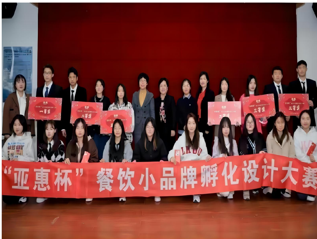
图 3-10：亚惠大赛师生合影

“亚惠杯”餐饮小品牌孵化设计大赛是财经商贸学院与合作企业“亚惠美食有限公司”联合举办的学生专业技能大赛，是财经商贸学院实现以赛促学、以赛促教、以赛促服务的又一项新举措。此次大赛的成功举办将推动学院校企合作进一步深度融合发展。