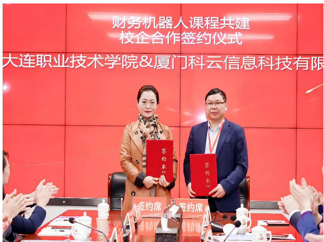
图 3-11：我院与企业签订课程共建合作协议