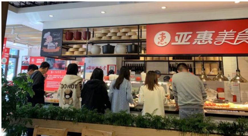
假期里来亚惠做顾客消费体验，学习站在顾客角度看问题