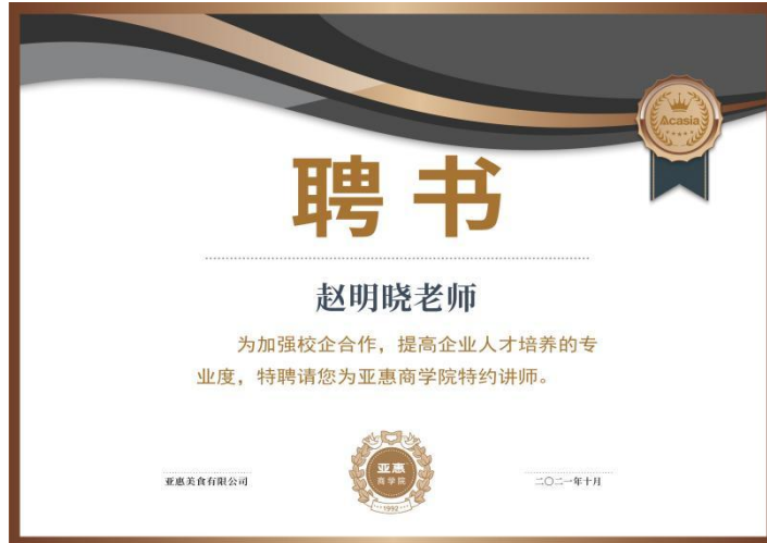
学院工商企业管理专业老师兼职亚惠商学院老师