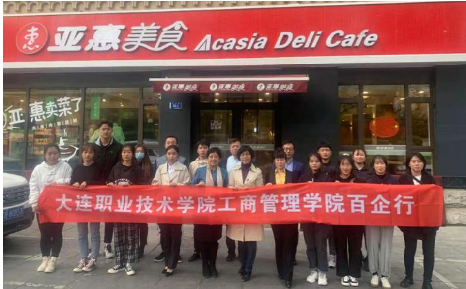
社团亚惠商学院体验活动