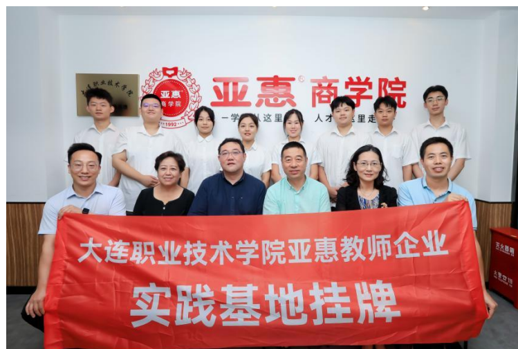
2022年8月亚惠成为大连职业技术学院教师实践基地