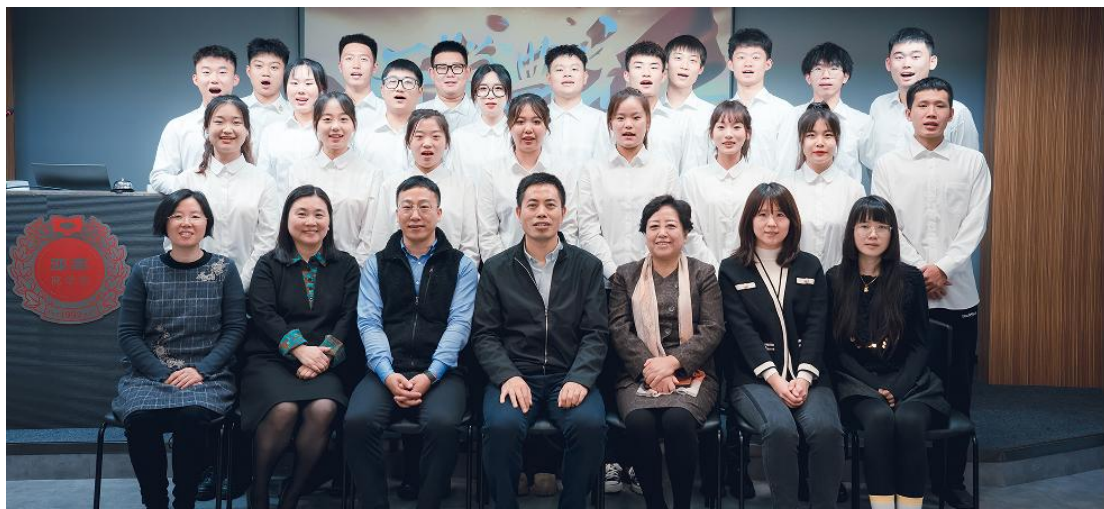
2022 年大职院实习生亚惠商学院开班仪式合影留念