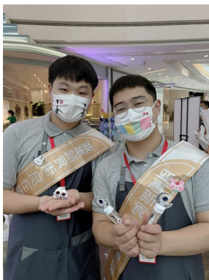
暑期来亚惠见习实习同学实训门店实践活动

2022年暑期12人在企业实践，亚惠为学生准备宿舍，集中食宿、轮岗实践、阶段学习工作总结，学生较好完成暑期实践工作。