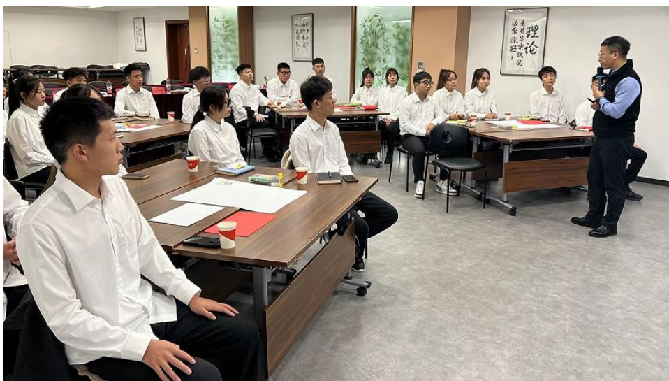
同学们在亚惠商学院的课堂上

亚惠商学院下设实训基地，实训基地各业态门店配备良好的运营管理人才，着力于实习生人才培养。实训基地门店，配有专门的带教师傅，设置了专门的实践内容和实践考核体系，按照培训计划培训流程，保证学生职业认知、工作技能、职业素养得到全面提升。