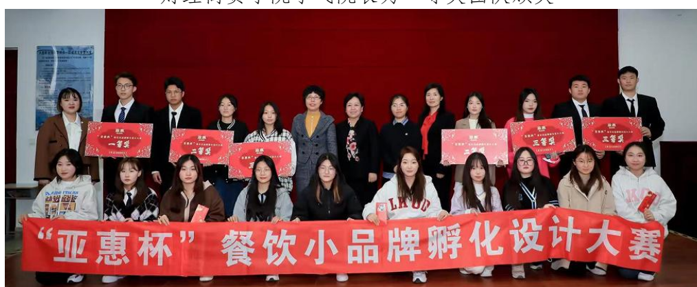
评委嘉宾与获奖团队合影