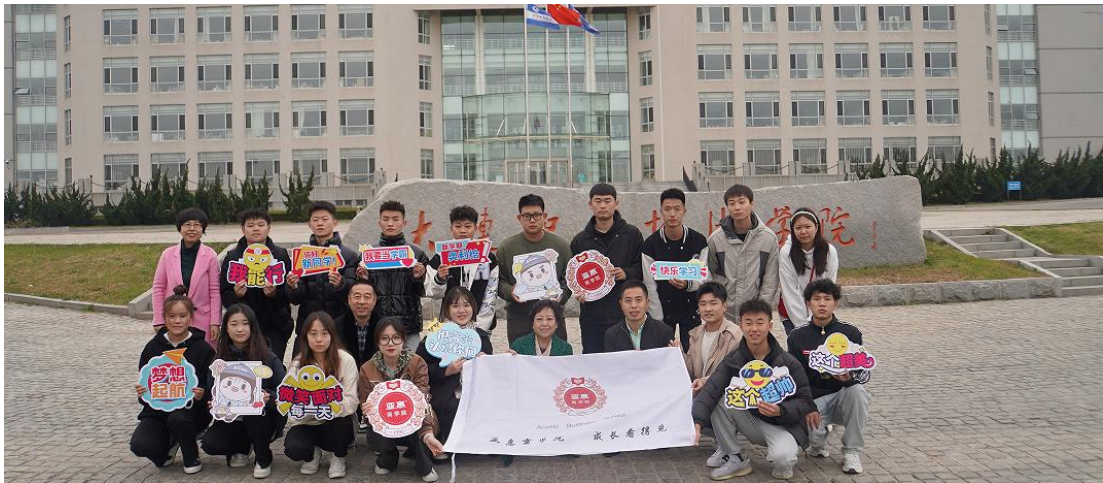
20 级亚惠订单班实习生离校合影