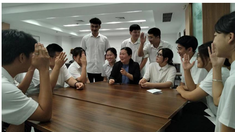
暑期来亚惠商学院实习的同学与学院企业实践老师热烈交流

亚惠的人才培养目标是门店店长。围绕着这样的培养目标，根据学生的实际情况分为六个培养阶段，每个培养阶段分别设置需要学习的课程内容，实习生首先在商学院完成每个阶段的理论学习内容，再到实习门店进行实操实践，通过了理论考核与实践考核后，每个同学还要做阶段性学习复盘总结，之后进行下一个阶段的学习考核。每通过一个阶段的考核，薪酬会随之提高。