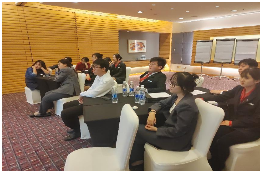
图 4-4 订单班学生在洲际集团酒店接受培训

2023 年 11 月酒店专业 23 名学生在洲际酒店集团进行综合技能实训(共 8 周，大连中远海运洲际酒店 11 名、大连体育中心皇冠假日酒店 4 名、大连星海皇冠假日酒店 6 名、杭州洲际酒店 1 名、北京新云南皇冠假日酒店 1 名)，促进校企合作。