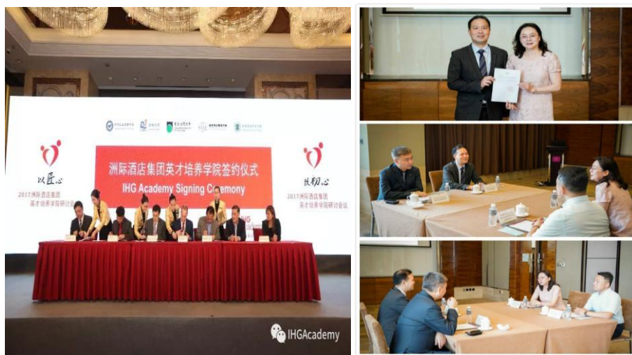
图 3-1 洲际英才学院签约仪式

目前，作为产教融合行业头部企业，企业专门组建专门团队提供产教融合、教育支撑服务、数字资源建设服务，包括教学资源开发、产教融合服务质量管控、人才培养服务支撑、教学服务等。其中，团队成员包括行业资深专家、企业资深工程师、企业高级技术人员、人力资源服务专家等，基于专业人员的技术支撑，与学院共同实施现代学徒制人才培养，协助学校推进“双师型”师资队伍建设以及“师徒制”人才培养模式改革。在专业群及专业建设、人才培养、资源建设、“三教”改革、产教融合基地、国际交流与合作等方面为高等院校提供全面化、个性化、最优化的解决方案。