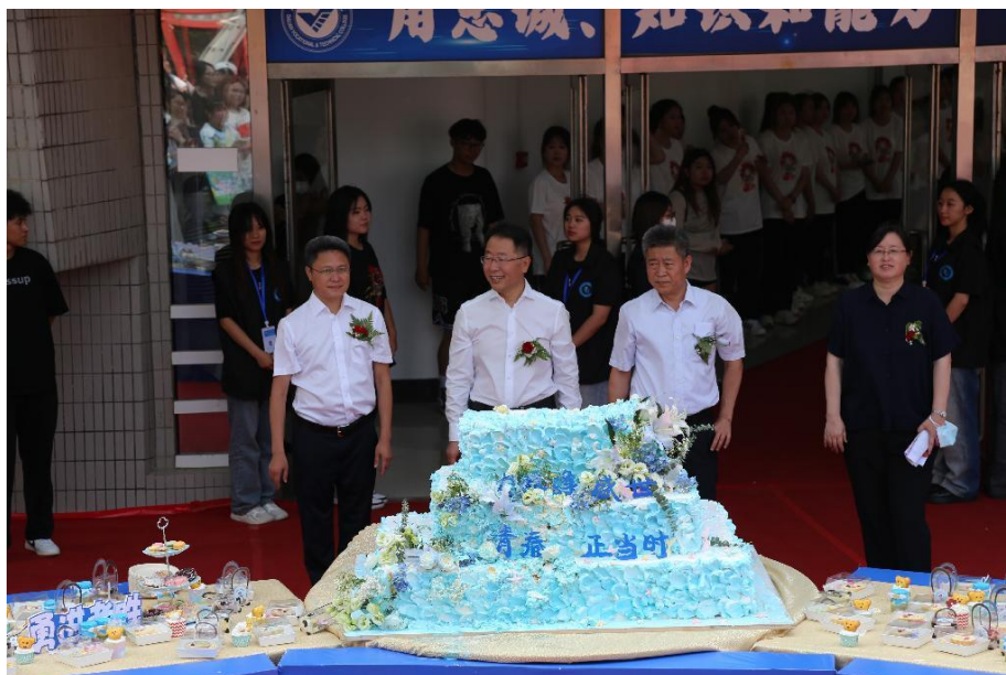
图 3-2 集团为 2023 届毕业嘉年华提供赞助