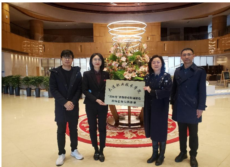
图 4-2 大连体育中心皇冠假日酒店“双师型”教师培养培训基地授匾仪式

集团接受学校教师到大连中远海运洲际酒店、大连体育中心皇冠假日酒店、北京临空皇冠假日酒店顶岗轮岗，顶岗周期为半年，轮岗岗位为人力资源部、餐饮部、前厅部等。与企业签订协议，完成实习及实践报告，搜集整理相关工作执行标准、教学案例。