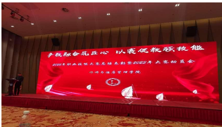
图 3-3 集团为学院大赛表彰大会提供场地