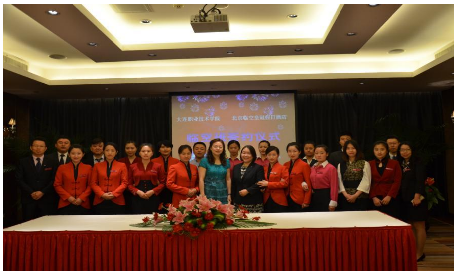
图 2-1 “北京临空皇冠订单班”开班

就洲际酒店集团发展、岗位需要，结合大连职业技术学院酒店管理与数字化运营专业的学情，集团与学院在彼此信誉充分认可的基础上，确立了深度合作意愿，并开始了积极的探索、调研、分析，共同确立了深层次校企合作模式，制定“订单班”运行计划，成立“北京临空皇冠订单班”“宁波洲际订单班”，签订了合作意向书，到目前为止已培养 241 名同学，并有多名同学成为集团管理培训生。