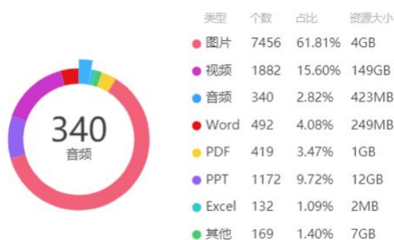
图 2. 线上教学第三至五周网络教学平台各类教学资源上传情况