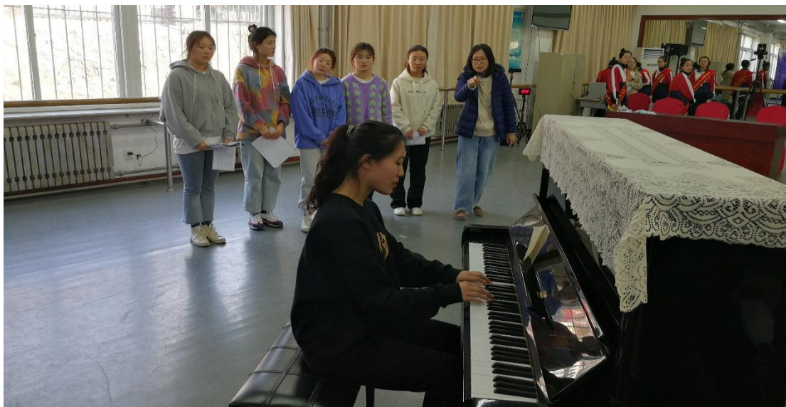
大赛内容融入日常课堂教学