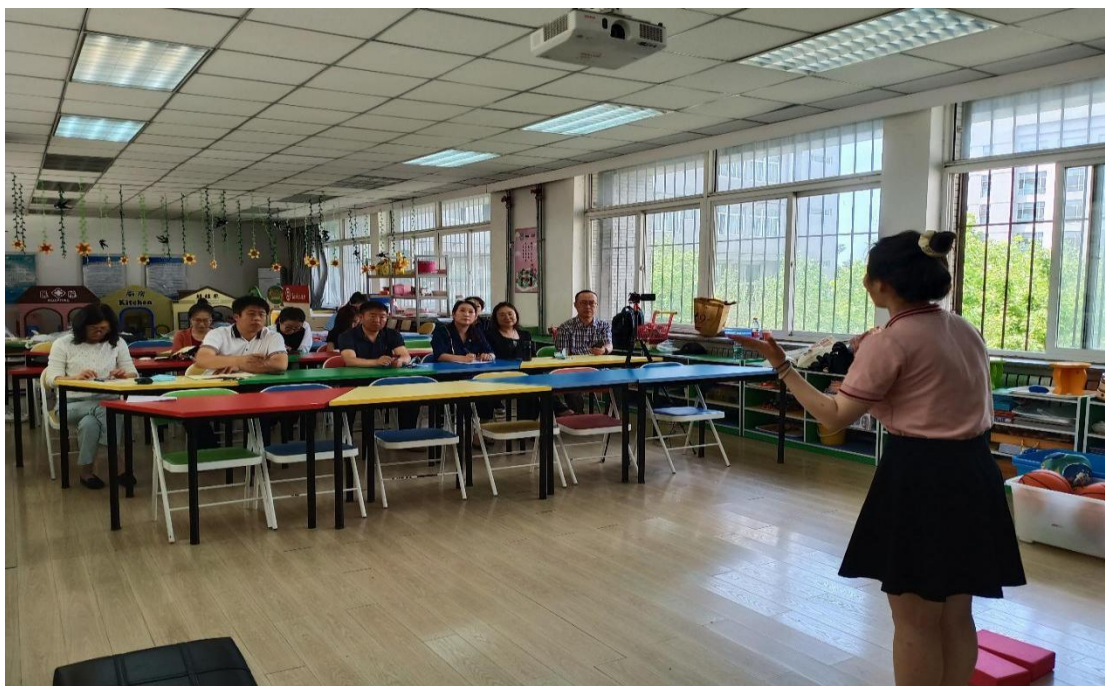
选手进行“校·园”拉练

大赛成果充分展示了学前教育专业学生的技能水平和专业素养，也展示了学前教育专业的办学水平和“以赛促教、以赛促学、以赛促改”的专业改革成果。