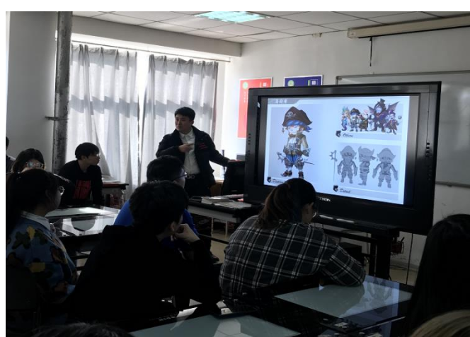
大连中软信息技术有限公司到校进行技能提升培训宣讲

专业积极与企业开展联系与合作，经过双方努力，专业共有 20 名同学参加了辽宁省专业转换及技能提升培训，同学分别到六翼螺动漫设计有限公司，大连