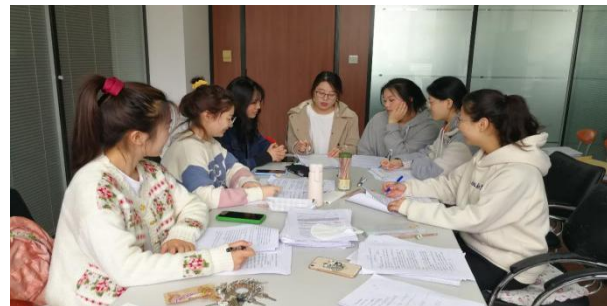
专项技能指导训练