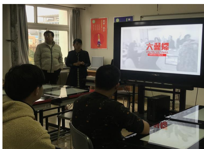
专业邀请多家企业到校进行招聘宣讲