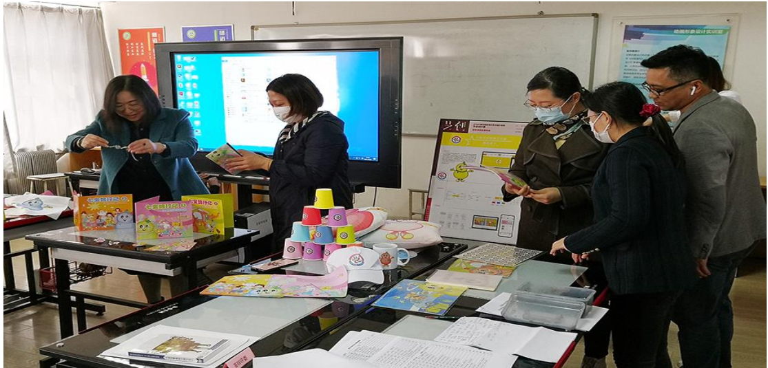
科研创新团队教师指导创新创业实践活动的情景